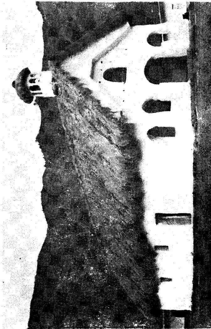
IGLESIA DE SAN ANDRES DE PISIMBALA Tierradentro - Colombia