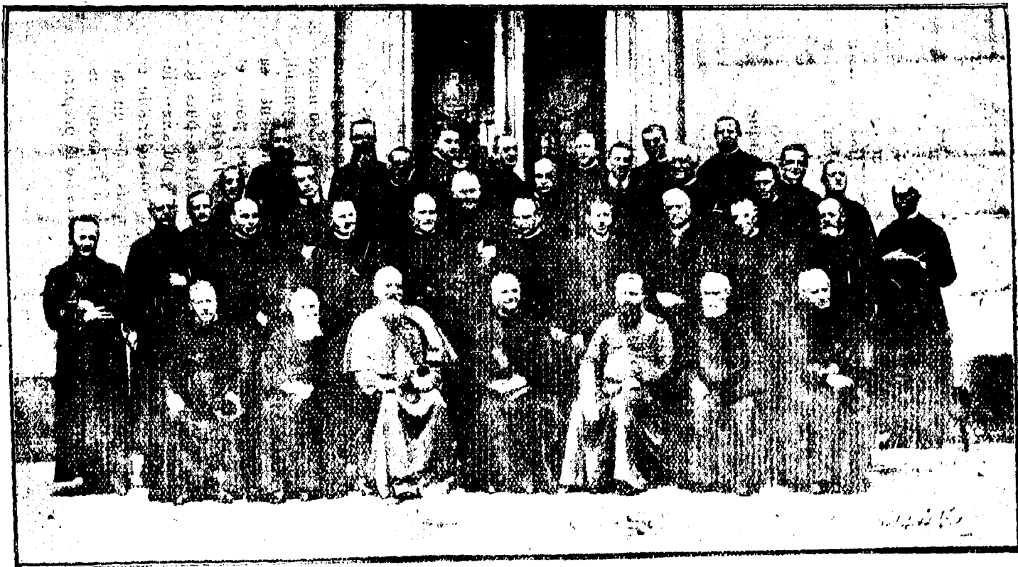
Assemblée sexennale 1925