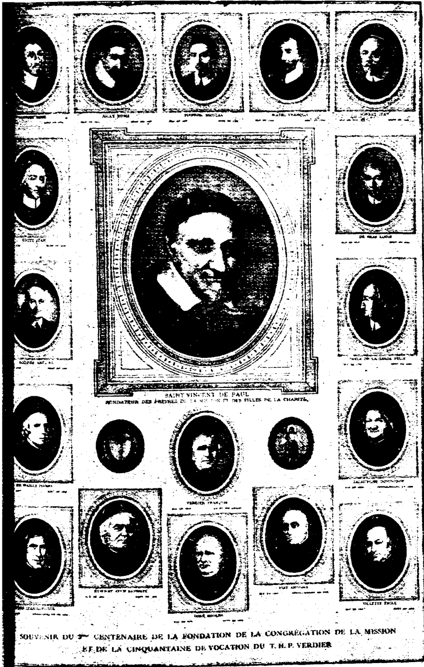
Les Supérieurs généraux depuis 1625